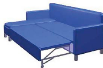
ST-050 Producent: FNFM Tagmet.

nowana została ewentualność zrywania się gwintu.